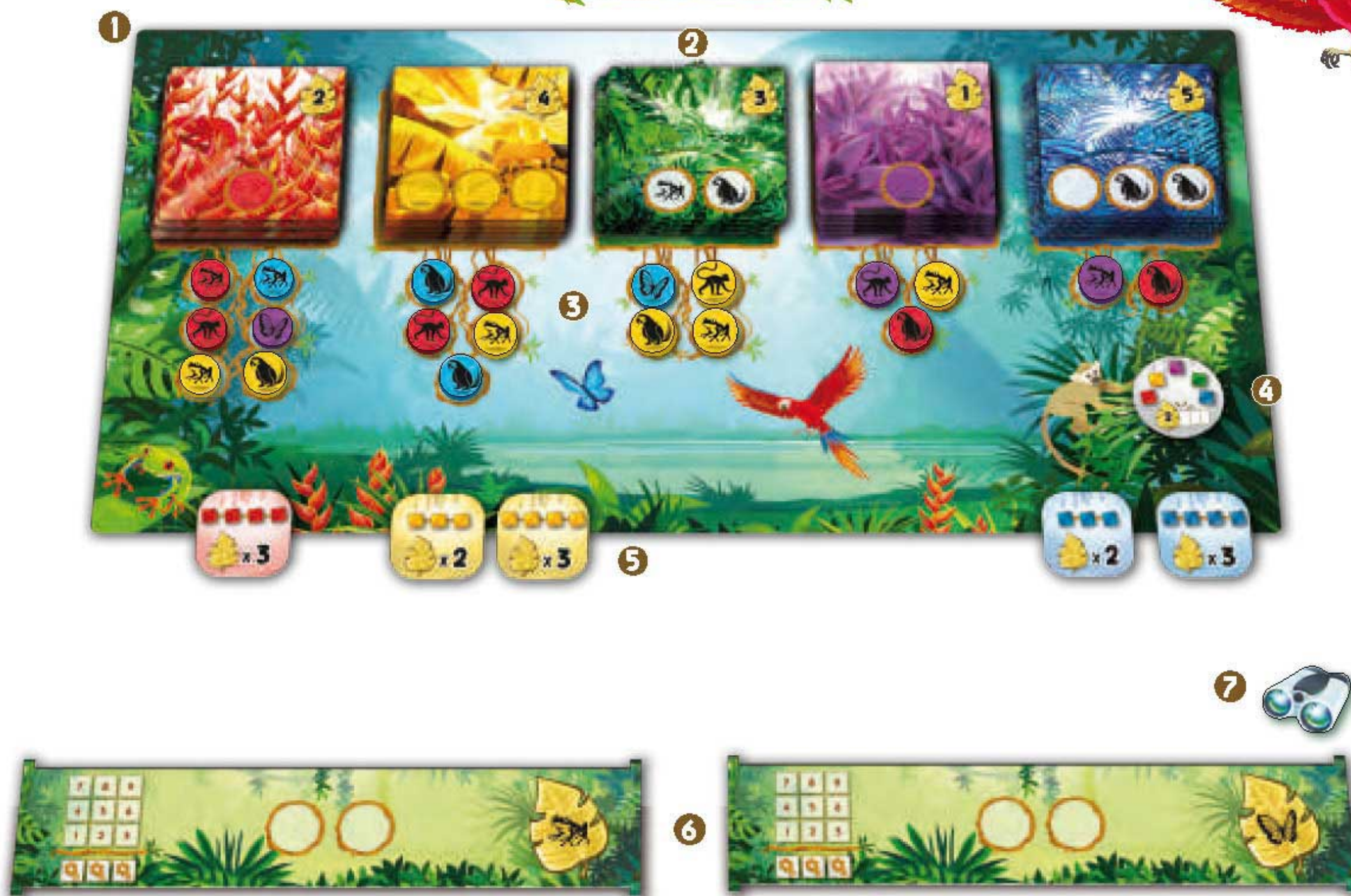
Exemple de mise en place à 2 joueurs