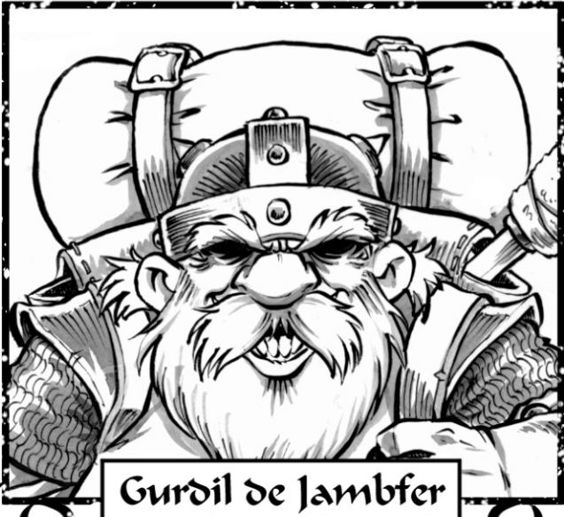
Gurdil de Jambfer