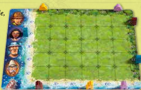
Exemple de configuration des îles au début de la partie

Il ne reste plus que l'aventurier marron, que Louis choisit de positionner à 60° sur la plage. Il décide ensuite de placer son temple marron à 70° côté jungle, ce que les autres joueurs font également.